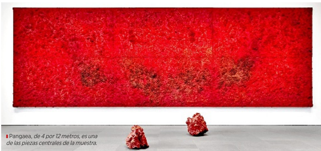
■ Pangaea, de 4 por 12 metros, es una de las piezas centrales de la muestra.

El artista mexicano invade con su obra el He Art Museum de Guangdong