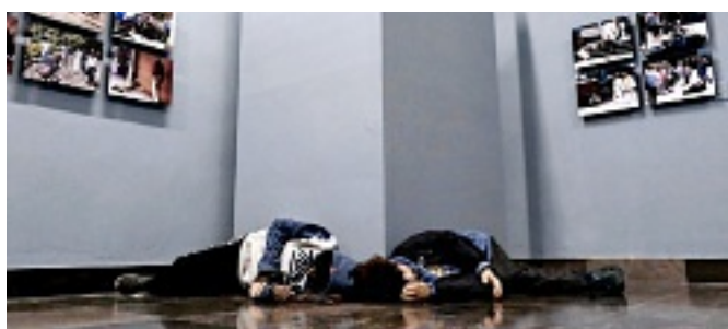
■ Así está montada la exposición de Emilio García Wehbi en el Edificio Arróniz.

De acuerdo con el numeral 7 del artículo 55 de la Ley de Servidores Públicos, los funcionarios deben “abstenerse de hacer propaganda de cualquier clase, dentro de los edificios o lugares de trabajo”, por lo que elogiar la labor de un líder religioso caería en ese supuesto.